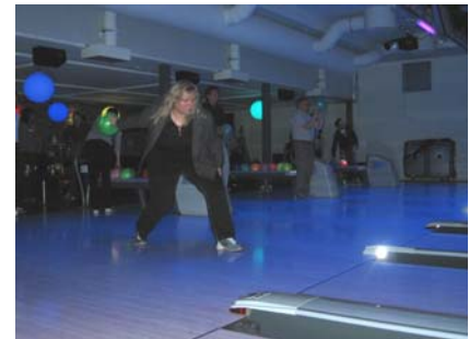
teksti: Jatta Pitkänen