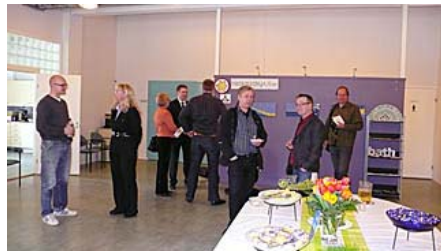
Yrittäjä Yrityshautomon avoimien ovien tilaisuudessa 19.4.2011