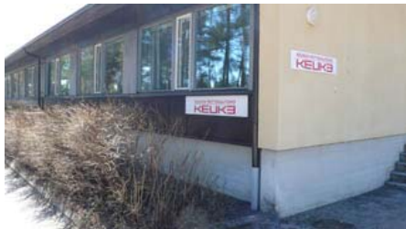
Keuken Yrityshautomo Nummelassa Vihdintie 32:ssa