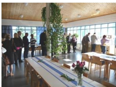
Grilliherkkujen nauttiminen käynnistymässä

Teksti Veikko Sirkiä