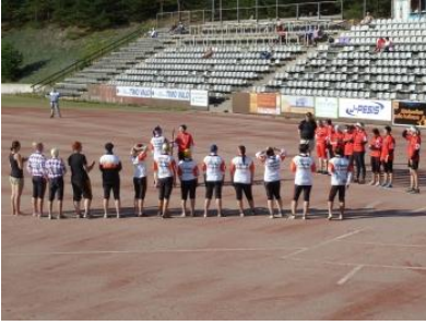
Hutunkeitto - PuMu voitti sen