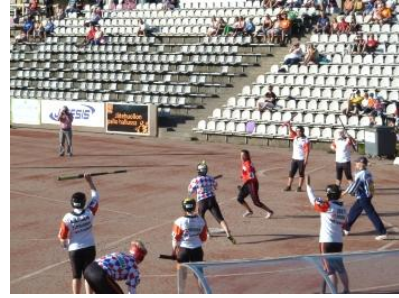
ViPan jokeri näpäyttää