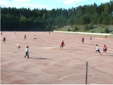
ViPa hallitsi näpäytykset: etenijät kakkoselta kolmoselle, ykköseltä kakkoselle ja näpäyttäjä kotipesästä ykköselle