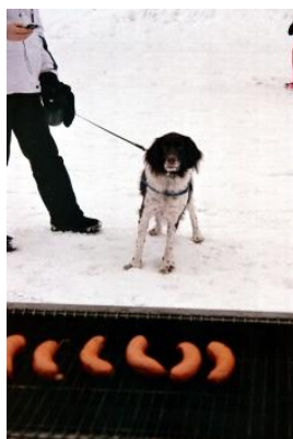
Anna mulle makkara - vaikka noi kaikki!