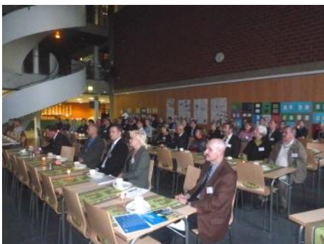
Yritysilan osanottajia Kuoppa-nummen koulukeskuksessa

Yritysilan osanottajat täyttivät sopivasti koulukeskuksen alakerran auditorion tiloja.