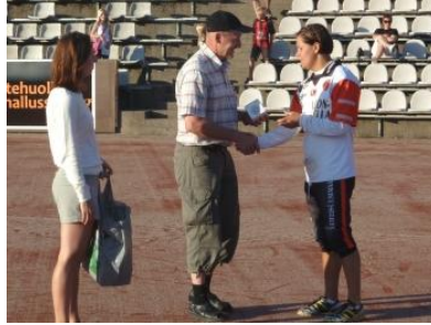
Illan parhaita palkittiin...