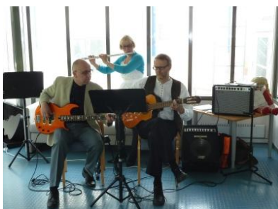
Viihdyttävästä taustamusiikista vastasi Trio Minstrelit