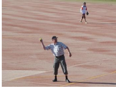
Leevin napakka avausheitto